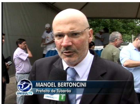
Figura 25 – Prefeito de Tubarão, Manoel Bertoncini, em 2009

Dois aspectos são ressaltados: infraestrutura e educação. No entanto, não fica em evidência o que a cidade “é”, ou seja, sua identidade, mas a expectativa otimista do prefeito em relação ao que a cidade “será”. Tendo em vista o desenvolvimento futuro, por meio de melhoramentos na infraestrutura de acesso e logística, salienta-se a necessidade de preparar as novas gerações para a realidade que está por vir.