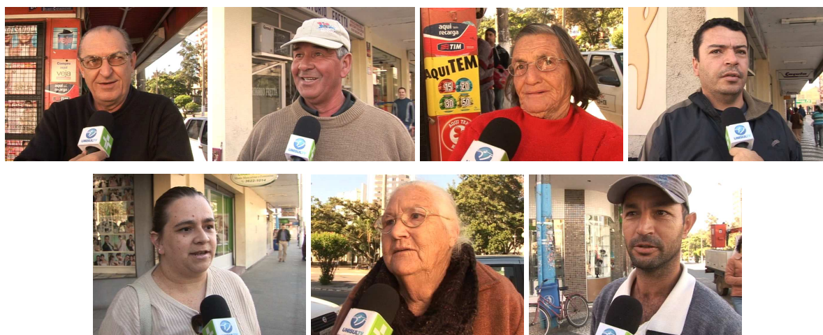
Figura 7 – Entrevistados da reportagem “Tubarão 137 anos”

Além do repórter, sete pessoas tiveram oportunidade de se manifestar. Mais uma vez, conforme se observou na escolha do tema, considera-se que a reportagem levou em conta os cidadãos como protagonistas.