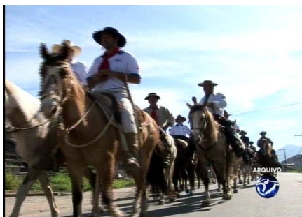
Figura 21 – Tropeiros refazem cavalgada pelo Picadão da Serra

É possível até mesmo estabelecer um paralelo com uma das imagens exibidas na reportagem “Tubarão 137 anos – Pólo Comercial”, quando um grupo de cavaleiros é fotografado descendo a Rua Coronel Collaço, nos primórdios da cidade. A data dessa fotografia não é informada, mas pelo cenário, inclusive pela antiga Catedral Diocesana ao fundo, percebe-se que o retrato data das primeiras décadas do século passado.