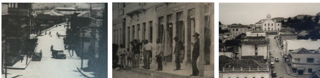
Figura 11 – Primeiras décadas do comércio em Tubarão

O OFF 2 prossegue com informações sobre a evolução do comércio de Tubarão em fins do século 19 e início do século 20: “Em 1885, Tubarão já tinha dentro de seu perímetro urbano 23 negociantes, um número pequeno comparado ao que o comércio representa hoje”. Embora as cenas utilizadas para cobrir o OFF deem a impressão de representar exatamente o assunto de que se fala, no caso, os 23 negociantes do perímetro urbano, a fotografia não deve ser dessa época.