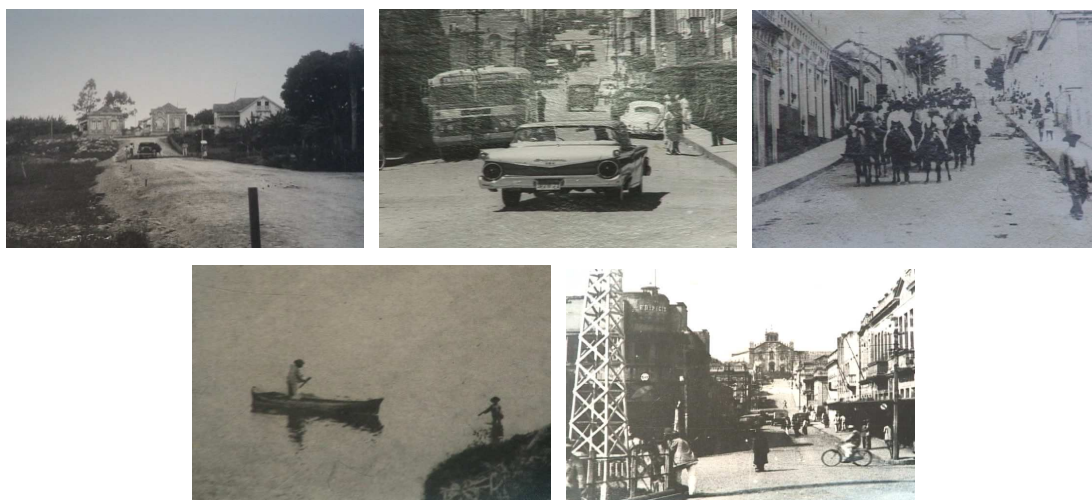
Figura 9 – Tubarão em tempos antigos

Na representação que se fez do município na reportagem “Tubarão 137 anos – Pólo Comercial”, a parte inicial, em que o repórter Ricardo Dias contextualiza o assunto, é coberta com fotografias que remontam aos primórdios de Tubarão. Em cinco quadros, mostram-se casas e ruas antigas, com destaque para a Rua Coronel Collaço, que dá acesso à Catedral Diocesana, e também canoieiros às margens do rio Tubarão.