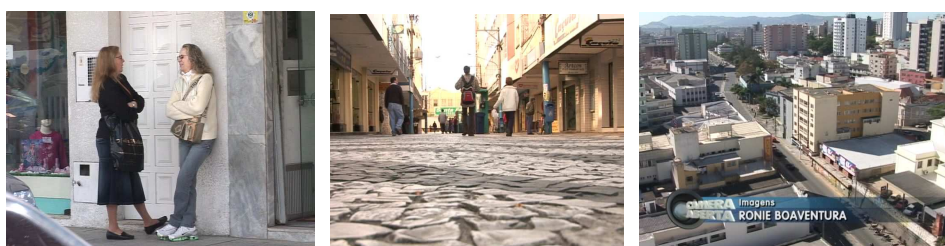
Figura 6 – “Cidade grande com ares de pequena comunidade”

Além das manifestações populares, referências a Tubarão como um bom lugar aparecem também na voz do repórter. No OFF 1, ele afirma: “Tudo tão calmo que mesmo em pleno centro da cidade dá pra parar e colocar o papo em dia. Reflexos de uma cidade grande ainda com ares de pequena comunidade”. O texto em OFF aparece coberto com algumas das imagens que seguem: