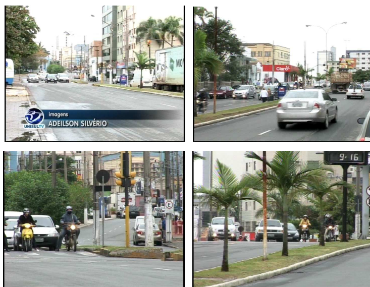
Figura 28 – Cidade de Tubarão no aniversário de 139 anos

A partir das constatações feitas, assim apresenta-se a ficha de análise: