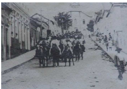
Figura 22 – Tropeiros na Rua Coronel Collaço (data não informada)

É possível até mesmo estabelecer um paralelo com uma das imagens exibidas na reportagem “Tubarão 137 anos – Pólo Comercial”, quando um grupo de cavaleiros é fotografado descendo a Rua Coronel Collaço, nos primórdios da cidade. A data dessa fotografia não é informada, mas pelo cenário, inclusive pela antiga Catedral Diocesana ao fundo, percebe-se que o retrato data das primeiras décadas do século passado.