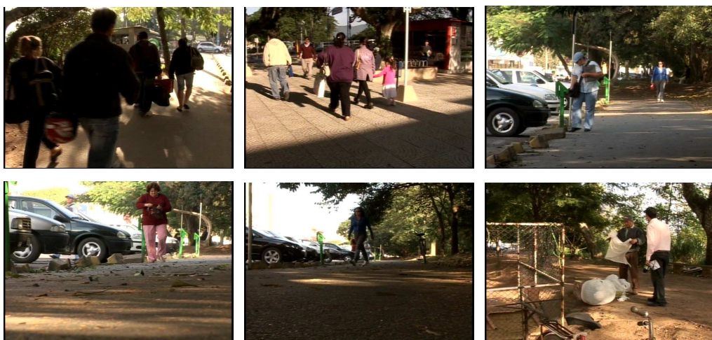
Figura 17 – Pessoas mantêm a rotina no aniversário de Tubarão

Nas cenas em que se privilegia o componente humano, todas se restringem a mostrar pessoas circulando em espaços adjacentes à Rua Lauro Müller.