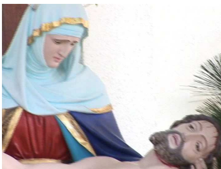
Figura 20 – Nossa Senhora da Piedade, padroeira de Tubarão

Há que se considerar que, conforme o Censo 2000, 14,9% da população não pertence à religião católica e, portanto, provavelmente não mantém devoção à Nossa Senhora da Piedade. Todavia, a santa padroeira ainda remete à fé que congrega boa parte dos tubaronenses. Trazida à cena, a imagem torna-se um símbolo de identificação para os católicos, um discurso visual próprio da mídia de proximidade, que “caracteriza-se por vínculos de pertença, enraizados na vivência e refletidos num compromisso com o lugar” (PERUZZO, 2011).