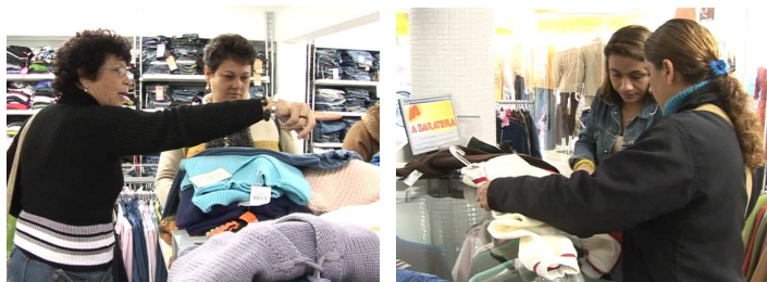
Figura 13 – Comércio em Tubarão