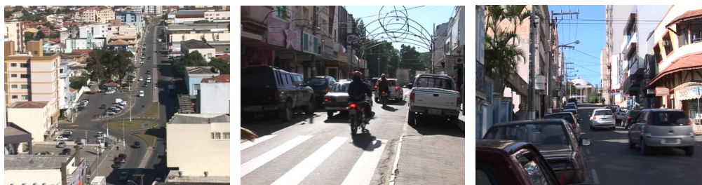
Figura 3 – Avenida Marcolino Martins Cabral, Rua Lauro Müller e Rua Coronel Collaço

Outras imagens exibem cenas da vida cotidiana da cidade. Mostra-se o movimento de veículos nas ruas e pontes; o Calçadão da Rua São Manoel, no centro comercial; o fluxo de pessoas pelas calçadas.