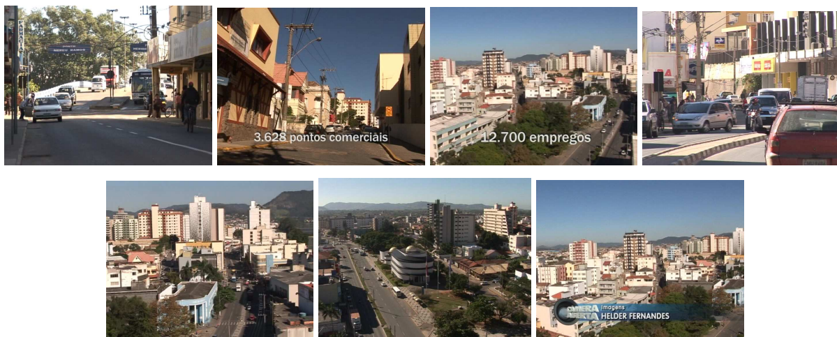
Figura 15 – Cidade grande, pólo comercial da região

As imagens procuram revelar uma cidade grande, movimentada, que corresponde à pujança de que se fala, como mostra boa parte das cenas que ilustram a reportagem.