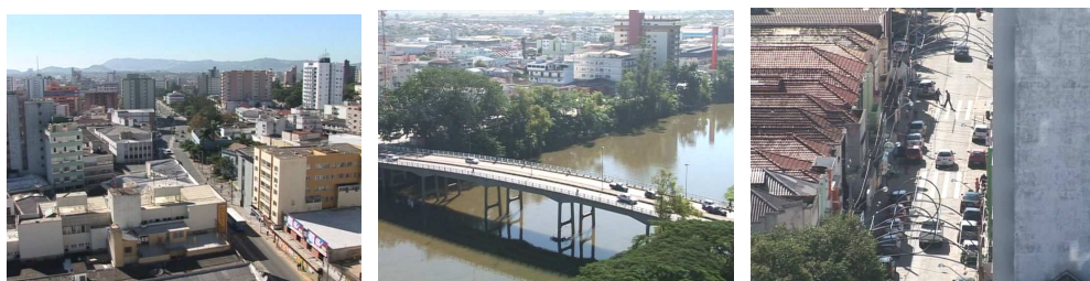
Figura 1 – Cenas de abertura da reportagem “Tubarão 137 anos”

Sob a perspectiva visual, é possível perceber que se buscou mostrar o município de Tubarão em sua dimensão urbana. As três primeiras imagens que introduzem a reportagem evidenciam essa opção.