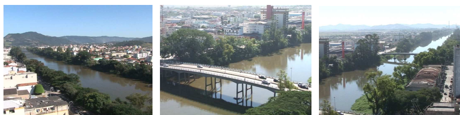
Figura 4 – Cidade cortada pelo rio Tubarão

Nota-se, também, que algumas tomadas em plano geral e de conjunto, com ou sem movimentos panorâmicos e de zoom , situam o cenário urbano em torno do rio Tubarão. Ao contrário de uma cidade como a maioria das outras, o destaque a essa particularidade geográfica pode, de certa forma, promover a identificação dos tubaronenses com o lugar onde vivem, pois se sabe que o rio dá nome à cidade e dela é uma das principais referências.