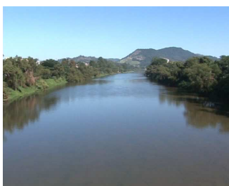
Figura 2 – Rio Tubarão – reportagem “Tubarão 137 anos”

Ao todo, a reportagem apresenta 22 cenas da cidade. Apenas uma, em que aparece o rio Tubarão, não corresponde necessariamente ao cenário urbano.