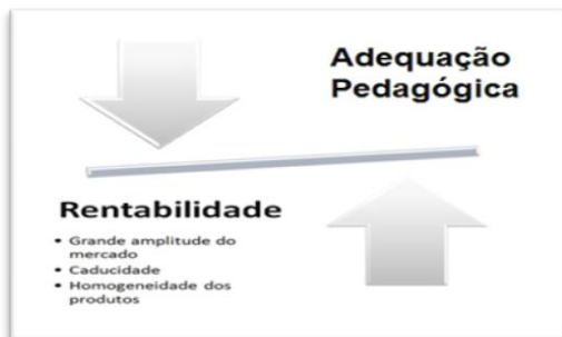
Figura 4 - O Livro-texto e a lógica do mercado.

Os livros-texto, no sistema escolar, têm se configurado como produtos com peculiaridades distintas dentro da lógica do mercado (Figura 4), dentre elas: a caducidade, o mercado assegurado para grandes tiragens de produtos homogêneos e o monopólio. Assim, esse contexto se configura como algo pouco adequado pedagogicamente, mas muito rentável do ponto de vista econômico, uma vez que “seu uso está garantido e legitimado pela própria política de organização e desenvolvimento do currículo, pela debilidade profissional e pela carência de outros meios alternativos”. (SACRISTÁN, 2000, p.153).