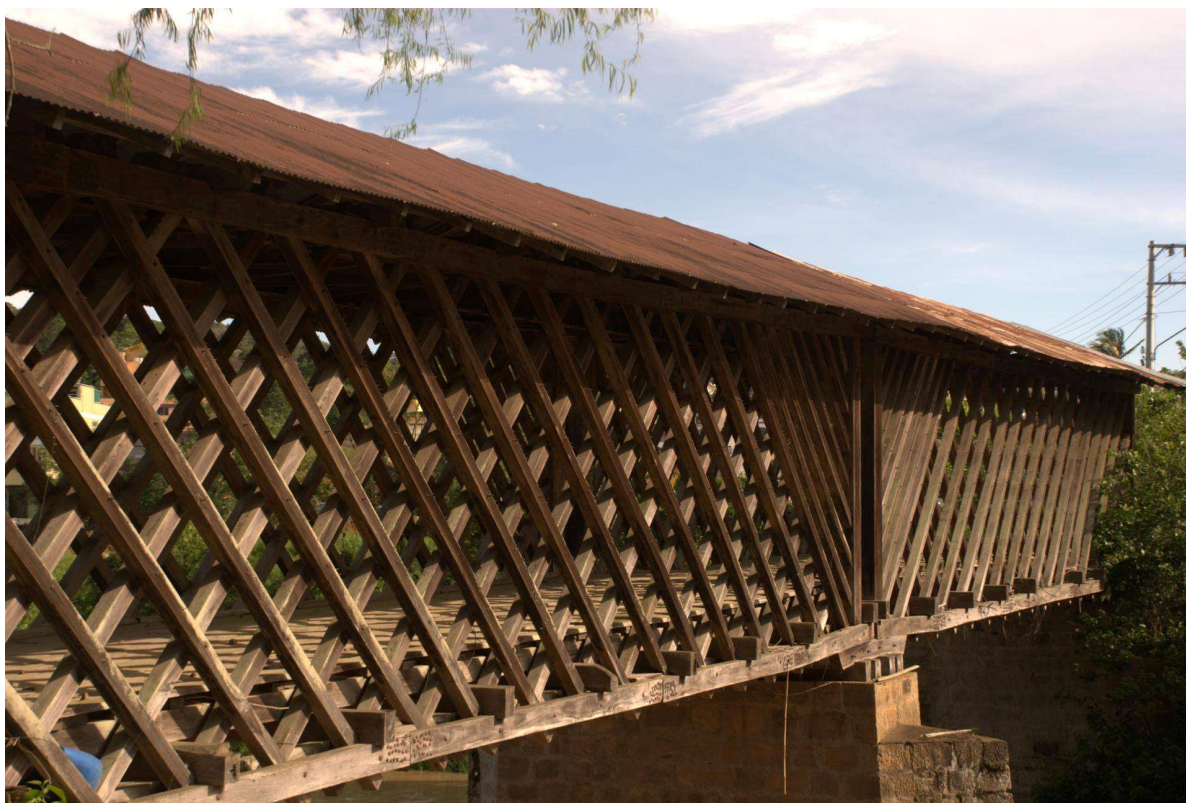
Figura 1: Ponte Roberto Machado 1953 – Taió/SC.

Dentro da região constata-se os mais variados tipos de empreendedorismo, com roteiros de aventura, acolhidas na colônia, turismo religioso, gastronomias típicas, bebidas artesanais e monumentos históricos.