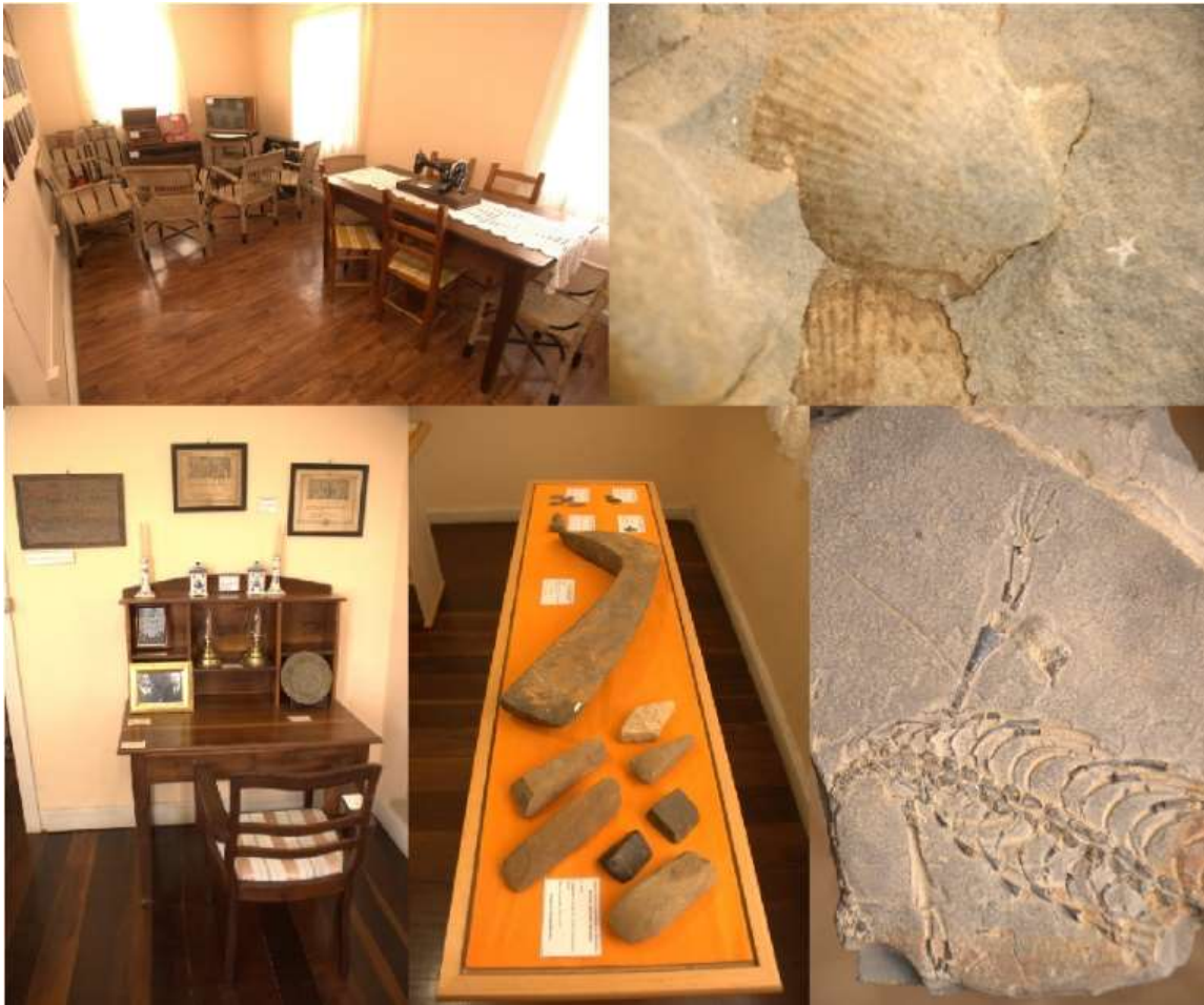
Figura 2: Museu Paleo Arqueológico e Histórico Prefeito Bertoldo Jacobsen.