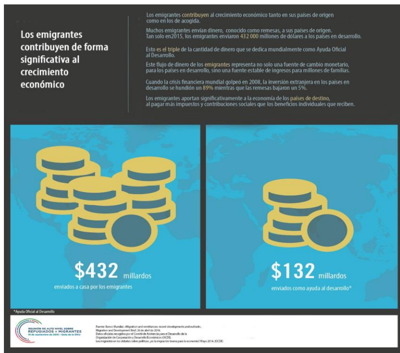
Figura 3 - Contribuições dos migrantes e refugiados ao crescimento econômico, 2016

1072