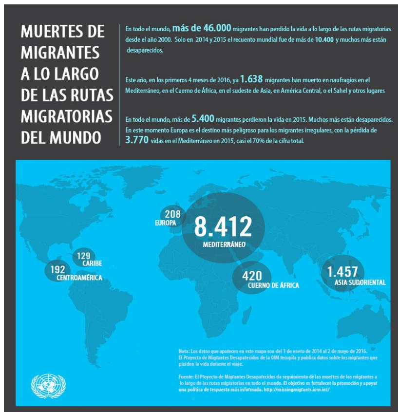
Figura 2 - Mortes de migrantes ao longo das rotas migratórias no mundo, 2014-2016

Fonte: Alto Comissariado das Nações Unidas para Refugiados – ACNUR (2016) 1064