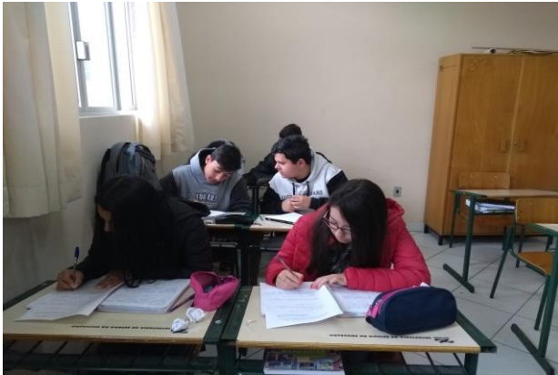
Figura 1 – Alunos respondendo questionário.