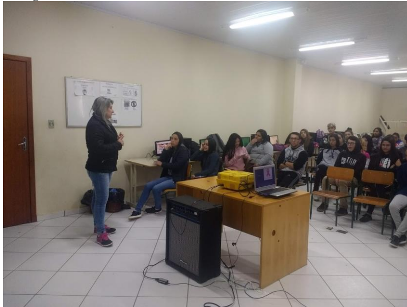
Figura 3: a autora dando início ao debate.