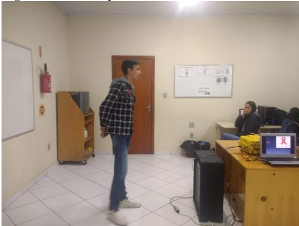
Figura 6: Alunos apresentando trabalho.