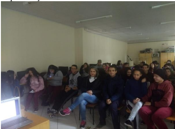
Figura 4: Professores e alunos assistindo a apresentação do seminário.

Posteriormente os educandos foram separados em dois grupos, onde um grupo trabalhou a AIDS e outro a Sífilis para apresentação de um seminário em Power point, com cartazes explicativos e vídeos abordados para outras turmas da referida escola.