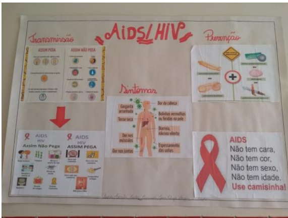
Figura 8: Cartaz feito para apresentação do seminário sobre: a aids.