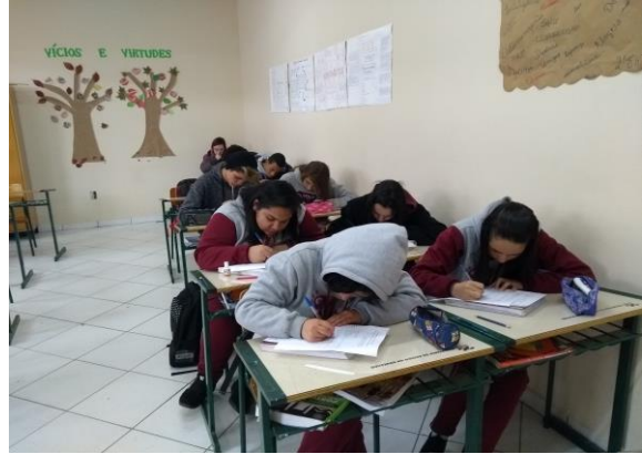
Figura 2 – Alunos respondendo questionário.