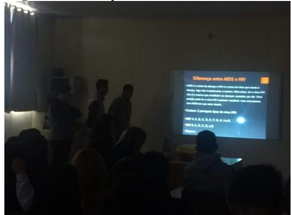
Figura 7: Alunos apresentando sobre a Aids.