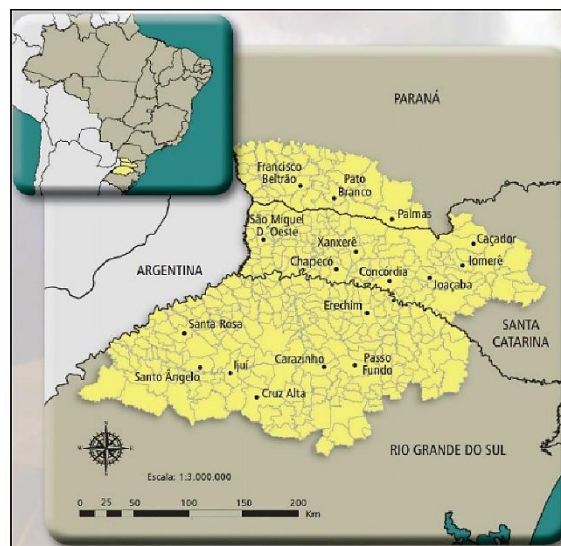
Figura 1 – Delimitação e localização da Mesorregião da Grande Fronteira do Mercosul

Por conseguinte, é pertinente evidenciar que a presente pesquisa está debruçada sob um fenômeno que ocorre no território da Mesorregião da Grande Fronteira do Mercosul, assim denominada e delimitada pelos Planos Mesorregionais de Desenvolvimento da Política Nacional de Desenvolvimento Regional (PNDR I). Esta mesorregião compreende um total de 396 municípios, com uma área de 120.763 km 2 e uma população de aproximadamente 3.815.791 habitantes, sendo que 23 municípios estão localizados na região norte do Rio Grande do Sul, 131 no oeste de Santa Catarina e 42 no sudoeste do Paraná. Sua matriz econômica registra significativas iniciativas de desenvolvimento industrial, porém, sua maior expressividade aparece no segmento da agricultura familiar, agropecuária e no setor agroindustrial, em que figura entre os principais expoentes na pauta de exportações nacionais e internacionais (MESOMERCOSUL, 2013).