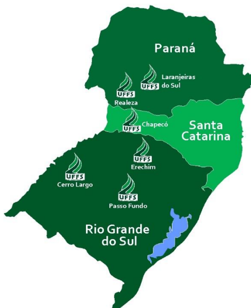
Figura 2 – Localização dos campi da UFFS